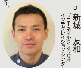
DT 新城 友和 プロ・ネマルクオッセオ インテグレイションセンター

技士講演 10:00~12:00 13:00-15:00 「インプラント上部構造形態の考察」 (長期経過の達成のために必要な要素) ※今回の技士講演は歯科医師の聴講も可能です。 歯科医師が技士講演の聴講でも歯科医師料金となります。